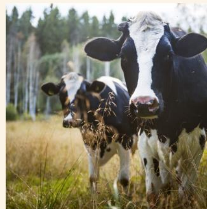
Antibiotikaspaning v 42-43