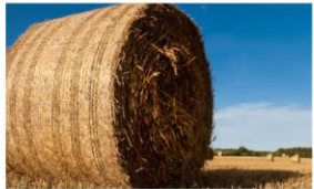
Cellulosa från jord- och skogsbruk