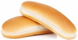
Restprodukter från livsmedelsindustrin