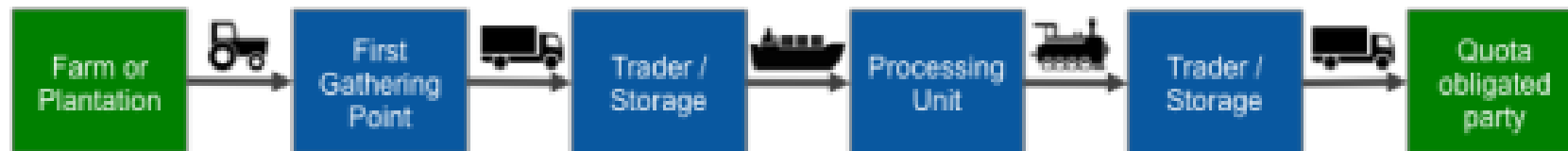
Figure 1: Example of a simplified supply chain for crops and agricultural crop residues