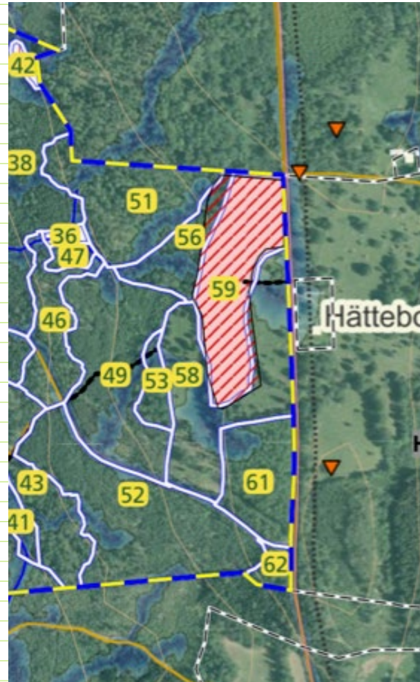
Kartutsnitt Grön skogsbruksplan

”Governed and managed in ways that achieve positive and sustained long-term outcomes for the in situ conservation of biodiversity.....”