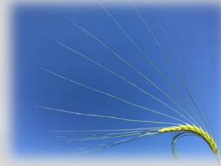
Insådd av rödsvingel