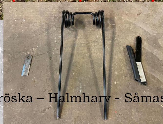
Tröska – Halmharv - Såmaskin