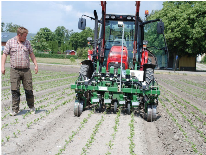
Ogräsrensning med robot hacka