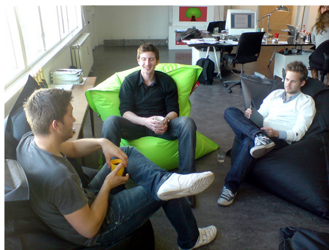
Skogsakademikerns vanligaste arbetsplats? Dagens skogliga tjänstemän befinner sig kanske inte i skogen så mycket som man kanske tror?