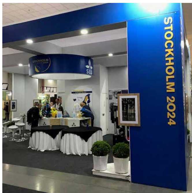
Den svenska monter vid IUFRO kongressen 2019 i Curitiba.

Som kan anas av detta så var deklaratonskrivandet bitvis en svår och mödosam förhandling fram till formuleringar som var acceptabla för alla. Deklarationens avslutning gjorde en blinkning till Greta genom följande slutkläm We reiterate the calls by the global youth to "listen to the scientists" and recognise the need for the science community to speak up in new ways to highlight the fundamental role science and technology must play in finding effective, economically viable solutions – samtidigt som de avslutande orden enbart lyfter upp den ekonomiska dimensionen. Hur som helst så diskuterades breda teman under kongressen och de långt över 200 sessionerna behandlade alla upptänkliga och aktuella skogligt relaterade ämnen. Möjligtvis kan man förvånas över att det saknades sessioner om forskningsfinansiering.