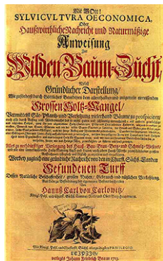
Hans Carl von Carlowitz bok gavs ut 1713.