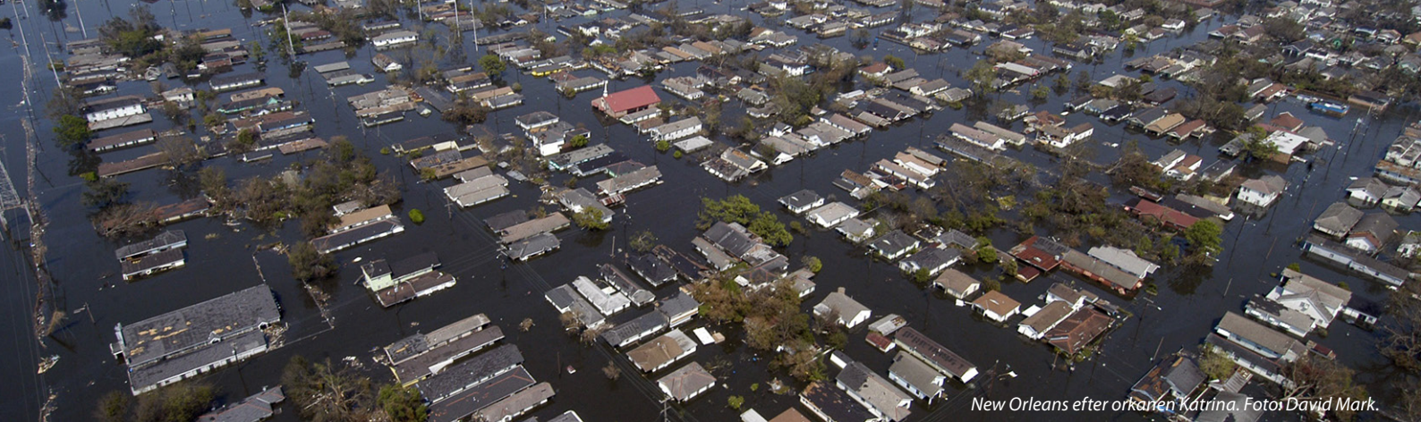
New Orleans efter orkanen Katrina.