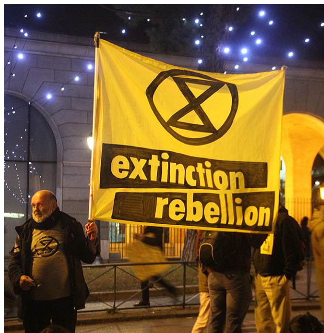
Extinction Rebellion agerar genom civil olydnad och icke-väld.