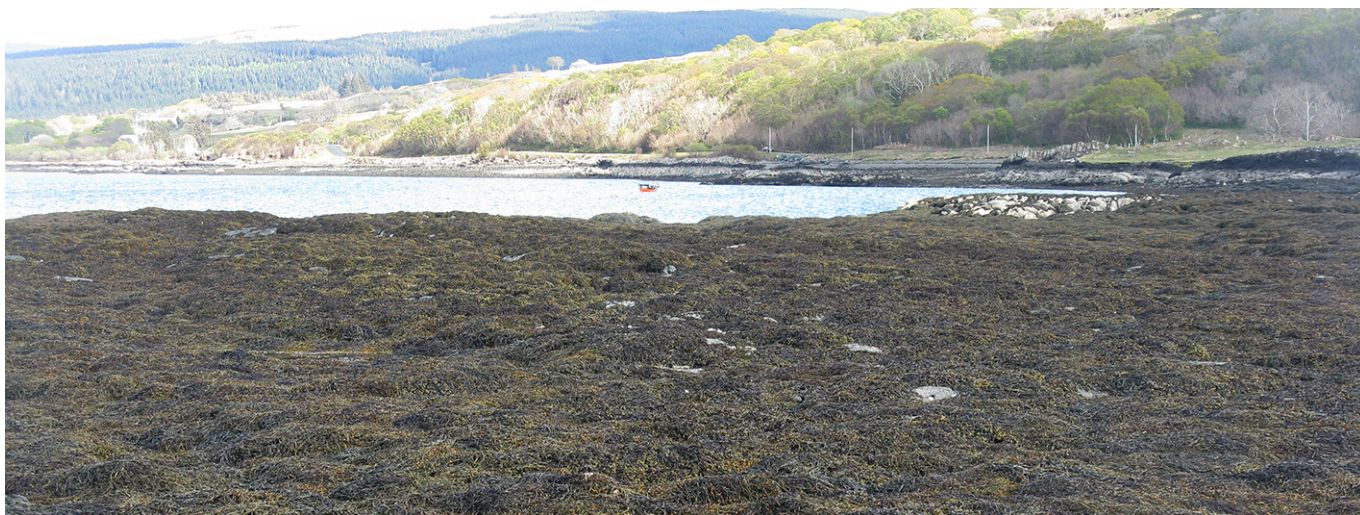
Stora mängder biomassa, som tång, hamnar på stranden särskilt i övergödda marina ekosystem. Det skulle kunna gå att hitta användning för den i olika sammanhang, något som fyto Remedieringsprojektet arbetar med.