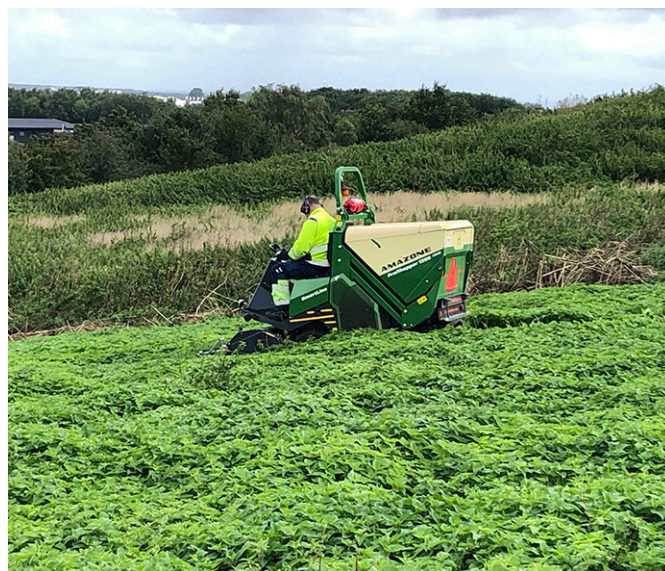
Skörd av nässlor på Filbornadeponin i Helsingborg.

I Helsingborg har Nordvästra Skånes Renhållnings AB i samarbete med Linnéuniversitetet en anläggning för näringsåtervinning av kväve i Filbornadeponin i nordöstra delen av staden. Om detta berättade projektledaren Angelika Blom. Försöken omfattar både odlingslådor med kontrollerade förhållanden och praktiska erfarenheter på försöksytor, bland annat testning av lämplig maskinpark och val av växter för bland annat biogasproduktion.