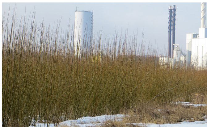
Salix, vide, är en viktig växt för att rena förorenad mark från tungmetaller och giftiga organiska ämnen.