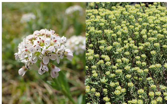
Hyperackumulerande är till exempel backskärvfrö ( Thlaspi caerulescens ) och gråddådra ( Alyssum alyssoides ).

Det visade sig under dagen att det inte alltid föreligger några skarpa gränser mellan dessa tre områden. Även om huvudsyftet kan vara att på olika sätt oskadliggöra oönskade organiska eller oorganiska ämnen i mark eller vatten kan tekniken också användas för att mer eller mindre kommersiellt anrika metalljoner (fytomining) eller näringsämnen. I huvudsak finns problemen i mark och sediment respektive i vatten men också i luften. I det senare fallet gäller det främst inomhusmiljöer där bladväxter kan vara både en prydnad och ha ett nyttigt syfte.