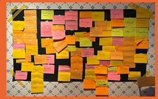
Intressenter i Källberga projektet.

Befolkningen ökar och urbaniseringen leder till konkurrens om marken. Vi ska värna biologisk mångfald och ekosystem – att det är miljömässigt och socialt hållbart på lång sikt. Klimatanpassning, energiförsörjning, matproduktion och naturmångfald behöver prioriteras och samverka i urbaniseringen för en långsiktigt hållbar förvaltning?