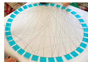
Analys av samband mellan intressenter, kärna i recepthandboken.