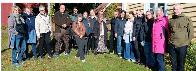
Caseutmaningsdeltagare och KSLA-representanter.