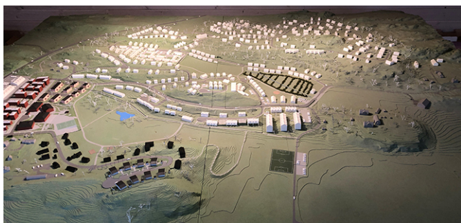
Visionen för Källberga, modell från Nya Boendet.

– Min biogeovetenskapliga utgångspunkt utvidgades till att rymma in allt som har med förvaltningen av hållbar stadsdel att göra, såväl näringsliv och som infrastruktur. Jag blev själv en mottagare för nya intressanta perspektiv och idéer från olika håll.