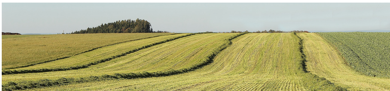
”Åkerbrukets erövringar är gynnsamma för friheten och samhällsordningen”

Det senaste decenniet har utan tvekan erbjudit enorma påfrestningar på samhället i allmänhet och de gröna näringarna i synnerhet. Efter Rysslands annektering av Krimhalvön 2014 försämrades det geopolitiska läget kraftigt i Europa. Den 24 februari 2022 eskalerade situationen i och med den fullskaliga invasionen av Ukraina. Användningen