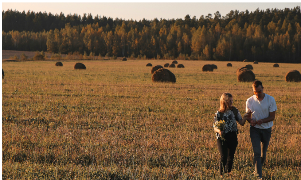
Enligt statistiken hade år 2023 59 procent av jordbrukarnas maka, make eller sambo arbete utanför jordbruket.