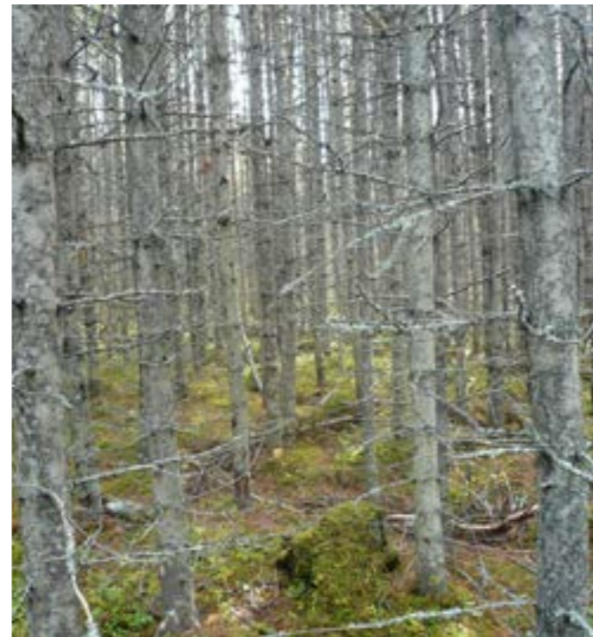
Ur ett trivselperspektiv skulle ingen sakna contortan.

Många vill se mer lövskog. Och det får de i framtiden för antalet lövträd ökar nu markant i Sverige. Men det beror inte på aktiv plantering – det handlar nästan enbart om självförnygrad björk. Att plantera andra lövträd, som ek, bok, ask och alm, är knepigare. Det kräver nästan alltid ett