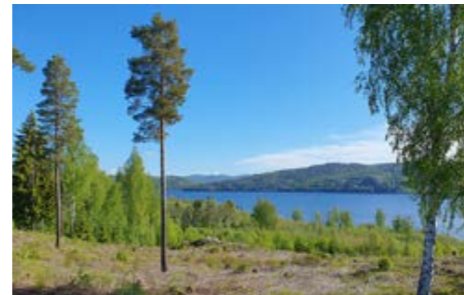
Utsikter mot vatten och horisont är inslag som många uppskattar.