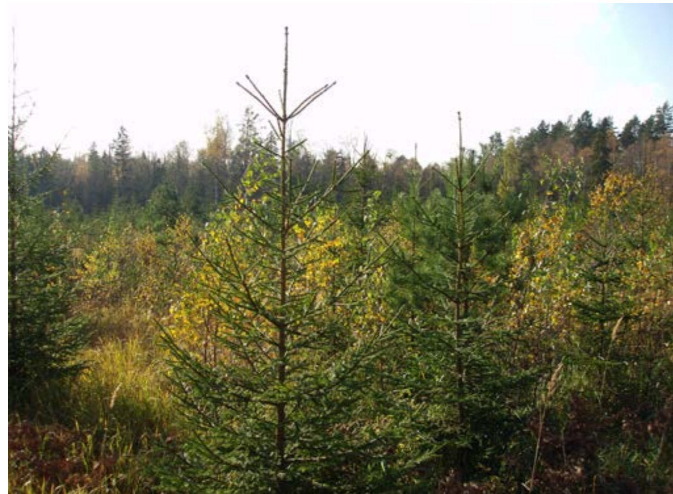
Här växer morgondagens pelarsal.

För en ägare som har som primärt mål att skapa bra strövskogar, till exempel en kommun, är långa omloppstider alltid att föredra eftersom andelen trevlig skog ökar, allt annat lika.