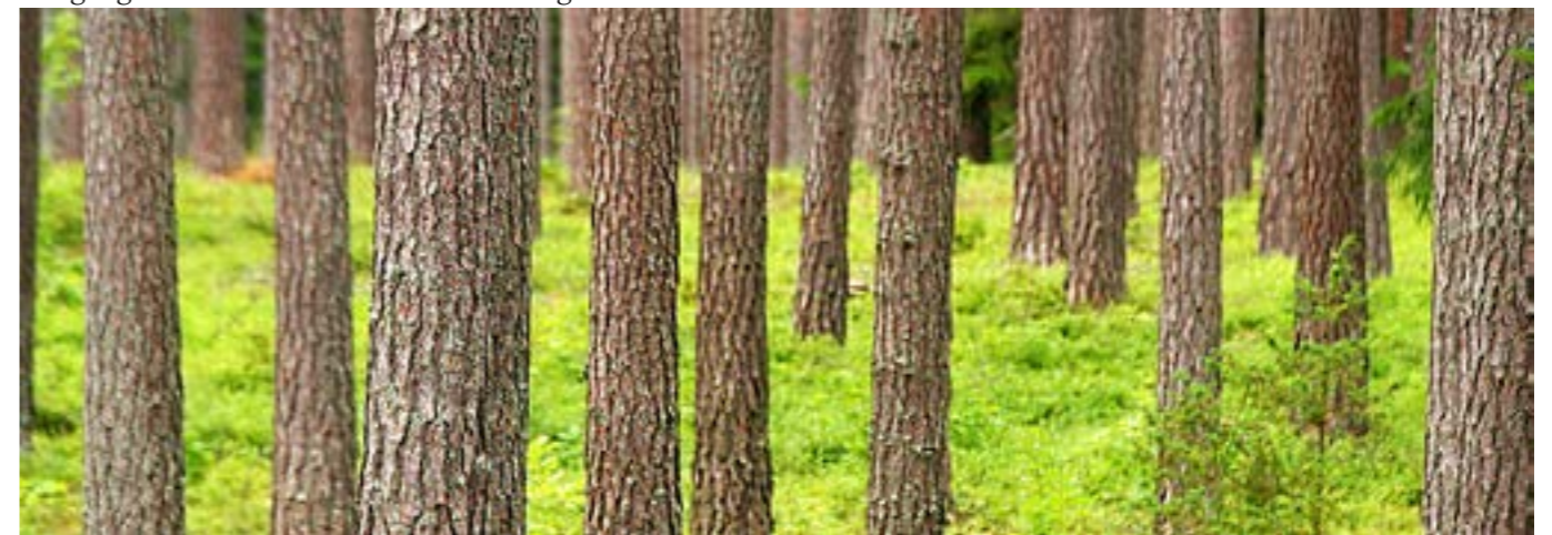
Ur trivselsynpunkt finns det många bra argument för tall istället för gran.

Ett nyligen markberett hygge är fult, men redan efter något år har hyggesvegetationen täckt marken och då syns inte spåren längre – även om de finns kvar ett antal år. Radikal markberedning som högläggning gör däremot hyggena svårgångna och den effekten kan sitta i länge.