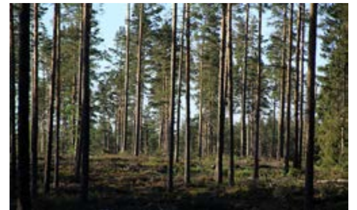
En tallskärm – ett alternativ till hygge.

Vår bedömning: Okej, även en långsökt idé. Men varför inte?