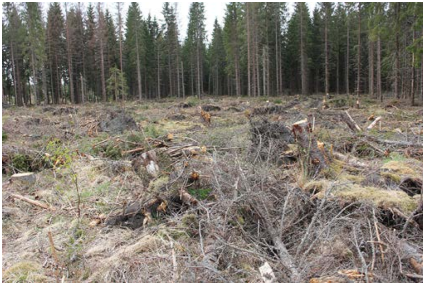
Hygget, skogsdebattens epicentrum.

Sannolikt kommer det åter krävas förändringar i skogsbrukets praktik för att minska polariseringen. Landets skogsägare kan möta detta reaktivt eller proaktivt.