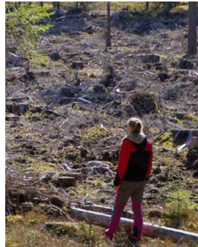
Små hyggen fördras nog av de allra flesta.

Vår bedömning: Tallskärmar kan vara ett bra sätt att göra skogen mer attraktiv. En del skärmträd kan stå kvar som evighetsträd, det gör skogen mer spännande.