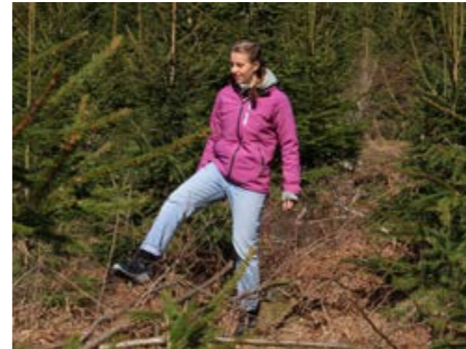
Nyröjda ungskogar är kanske den sämsta rekreationsskogen av alla. Men att inte röja blir än sämre på sikt.

hägn för att hålla borta älg och hjort. Hägn är dock dyra att sätta upp och behöver återkommande tillsyn. I praktiken krävs engagerade skogsägare som bor nära sin skog. Undantaget är björkplanteringar, som kan gå bra utan hägn.