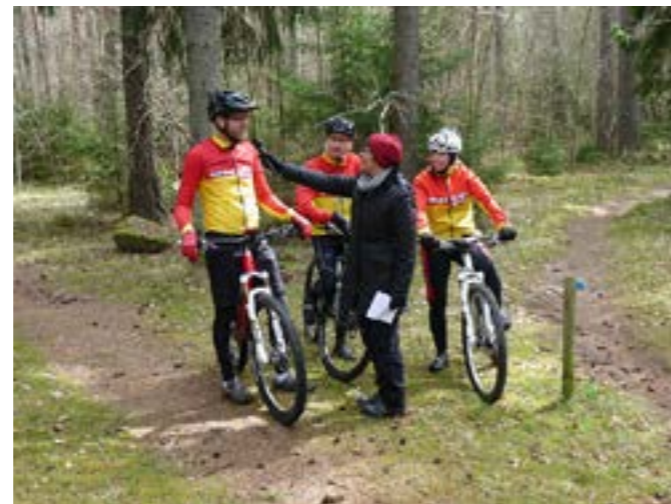
Nya intressenter i skogen. Diskussion med representanter för mountainbikeklubben Mera Lera i Linköping.

Avslutningsvis har vi ett, möjligen naivt, förslag: Ta mer av skogsdebatten ute i skogen. På ”rummet” blir det abstrakt, teoretiskt och filosofiskt. Dessutom pratar vi så lätt förbi varandra – alla har vi våra egna, inre bilder av hur skog ser ut. Ute i skogen måste alla förhålla sig till den verklighet man ser: markens bördighet, tidigare markanvändning och skötsel och dagens trädbestånd. Då kan det bli en bra, konstruktiv och mindre polariserande skogsdebatt.