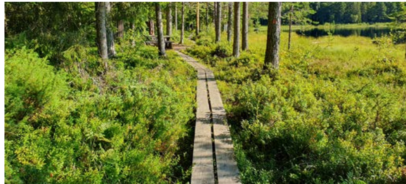
Trivsamma skogar har bra stigar, leder och spår.

de allra flesta som fula. De är dessutom mer eller mindre oframkomliga under lång tid, då marken är täckt av toppar och grenar. Skörd av skogsbränsle minskar problemet, men det försvinner inte.