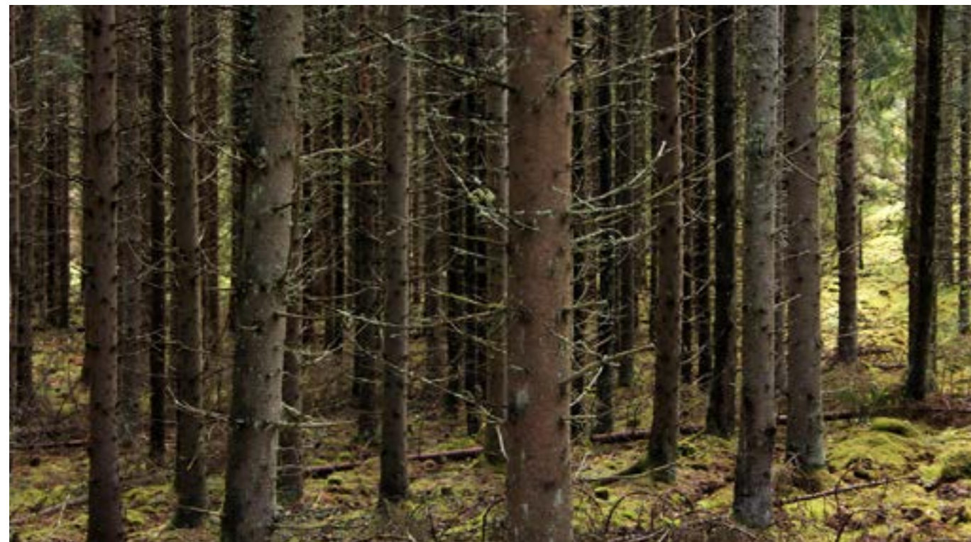
Ogallrad skog blir ofta väldigt tät och oframkomlig.

Vår bedömning är att gran, tall och bok är de trädslag som har bäst förutsättningar att ge bra strövskogar i Sverige. Vi kommer i fortsättningen inte diskutera bok närmare, eftersom det är ett litet trädslag, det svarar i dag för 0,7 procent av landets virkesförråd, som endast finns i södra delen av landet (om än på väg norrut...).