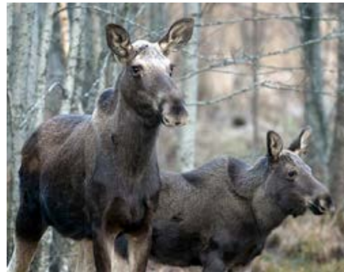
Älgen begränsar handlingsfriheten i skogen.

Vindfällan är nog den viktigaste enskilda faktor som kan fälla våra idéer. Några kraftiga stormar efter varandra kan sänka intresset för ett mjukare skogsbruk. Då är risken att desillusionerade skogsägare i stället går över till ett riskminimerande skogsbruk med stora hyggen, korta omloppstider, täta skogsbestånd, inga skärmar, få miljöträd och ingen självföryngring med fröträd. Detta skulle göra skogarna mycket tråkigare.