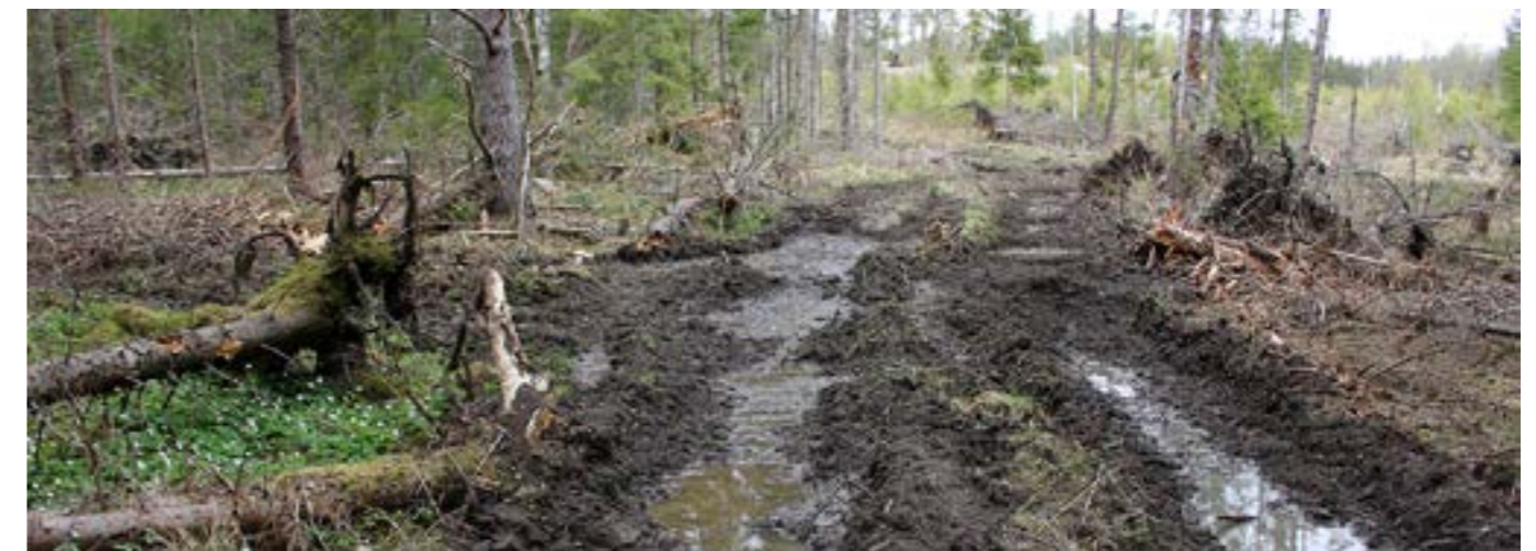
Körskador sänker skogens trivselsvärde.