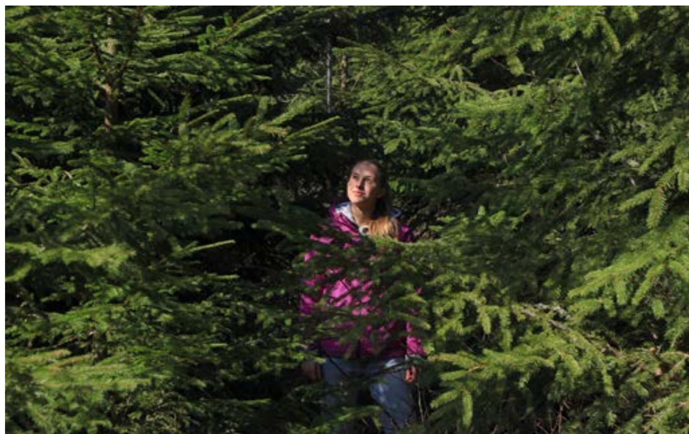
Granifiering, en av flera stora förändringar av det svenska skogslandskapet.

Varför har vi då en så hård debatt kring skogen om nu de flesta är någorlunda överens om så mycket?