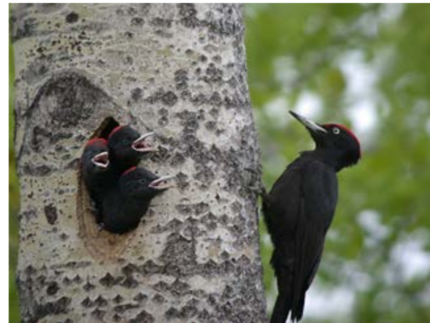
Det kan bli bra: sparad hänsyn blir gamla aspar till spillkråkan.