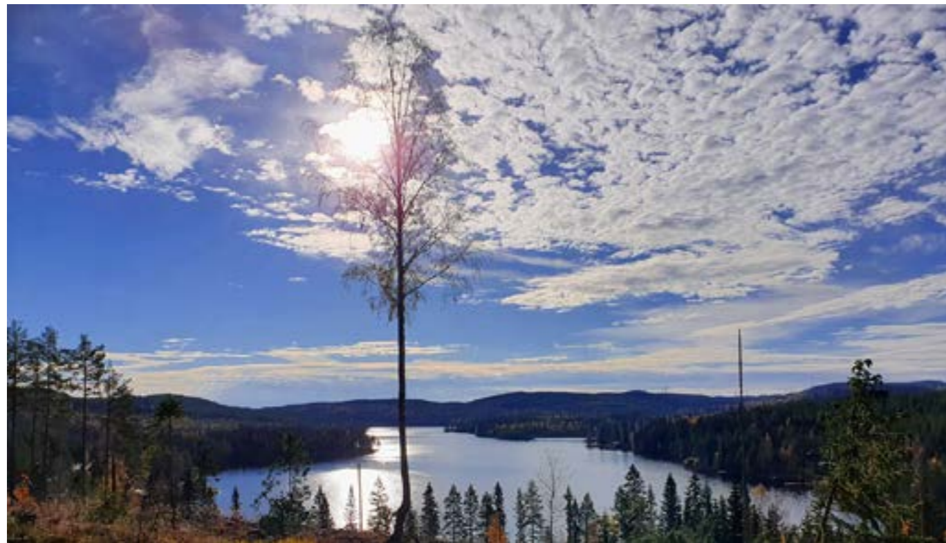
Tänk som en landskapsarkitekt, öppna upp utsikter mot sjöar och höjder.