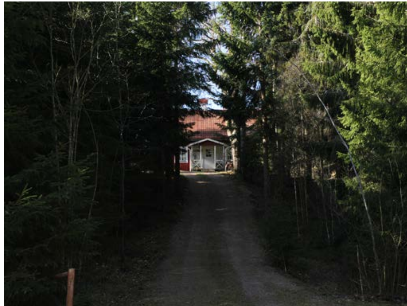
Det behöver utvecklas robusta alternativ till gran.