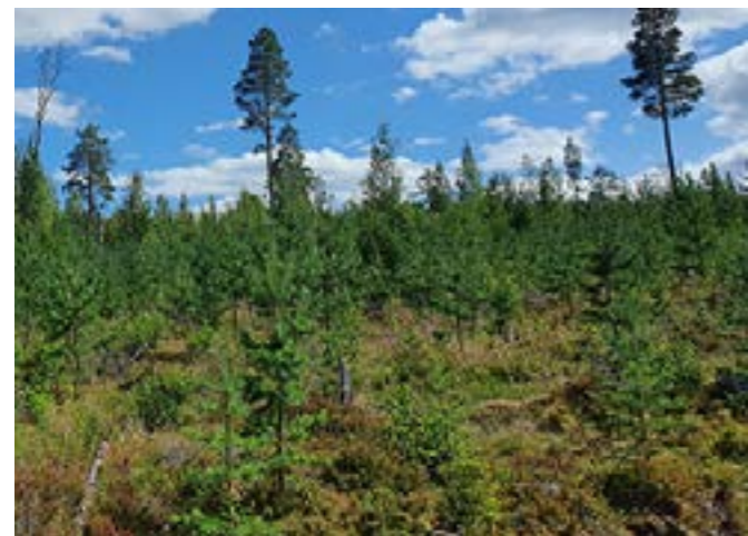
Hur ser kalhyggen som inte planteras ut om ett antal år?

Det finns i dag ca 600 000 hektar med den nordamerikanska contortatallen i Sverige.