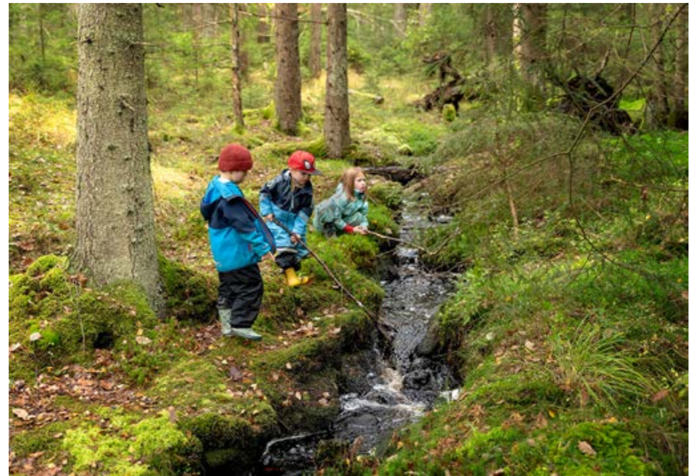
Skogen – den naturliga lekplatsen.