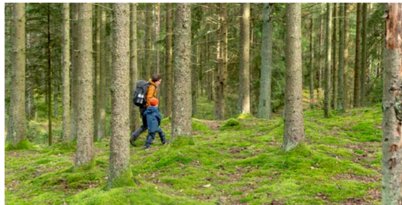
Ut i skogen ska vi gå...