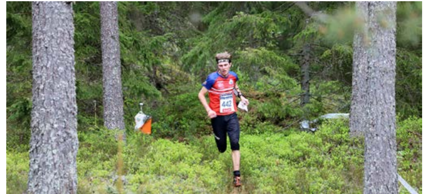
En framkomlig skog är nästan alltid röjd och gallrad i ungdomen.

Röjd och gallrad... Skogar som anlagts med dagens skogs-skötsel blir oftast väldigt täta – speciellt om det blir ett tätt uppslag med självföryngrad björk. Röjs och gallras inte dessa skogar blir de med tiden mycket svårframkomliga. Man får kryssa sig fram mellan stammarna, dessutom dör många träd av trängseln. Stående och liggande döda träd sänker rekreationsvärdet.