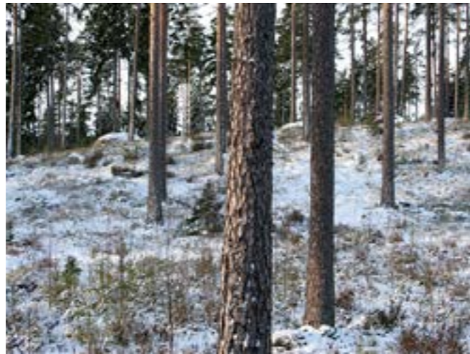
Fröträdställning i Dalarna. Naturlig föryngring under fröträdd – ett trivsamt alternativ.

Naturlig föryngring kräver oftast markberedning för att tillräckligt många tallplantor ska komma upp inom en