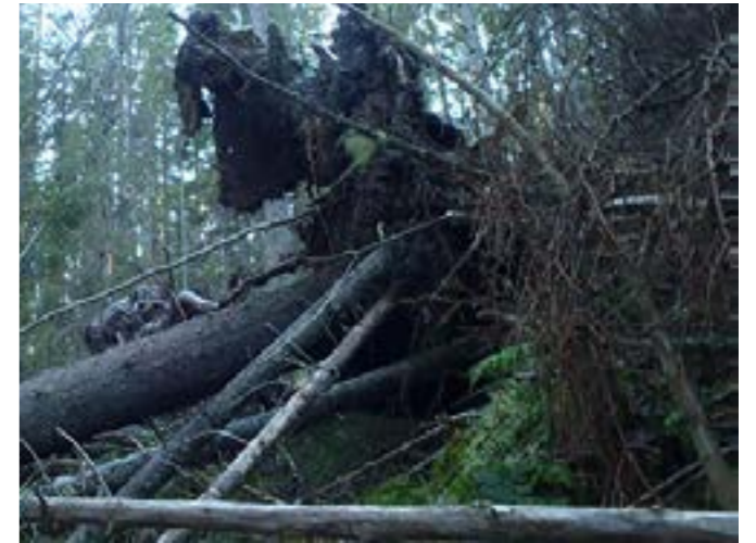
Stigar genom gammal skog lever alltid farligt.