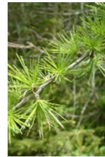
Nyutslagen lärk.

Merparten av alla hyggen får ett tätt uppslag av björkplantor. Oftast röjer markägaren bort merparten av björkarna för att gynna sina tall- och granplantor. En nyröjd ungskog torde vara den sämsta rekreationsskogen av alla. Det sticker upp små, vassa